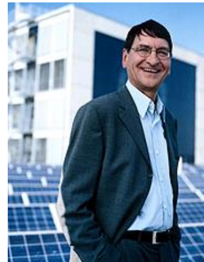
Reiner Lemoine Gründer der Reiner Lemoine- Stiftung